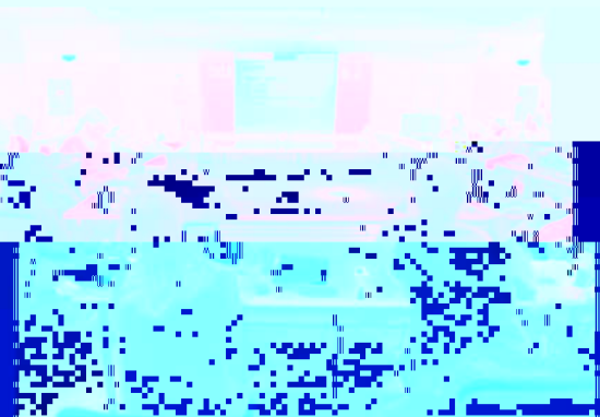
参会人员合影留念